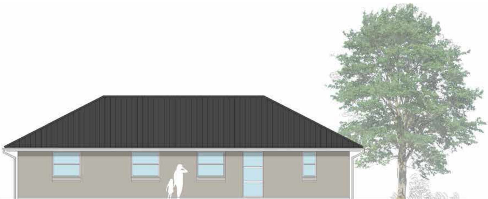
Facade mod vej 1:100