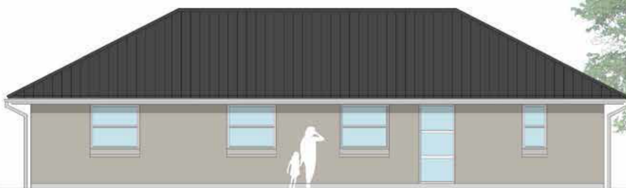
Facade mod vej 1:100