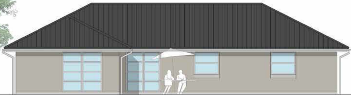
Facade mod have 1:100