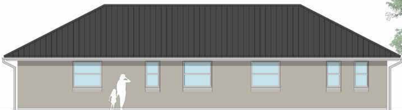
Facade mod vej 1:100